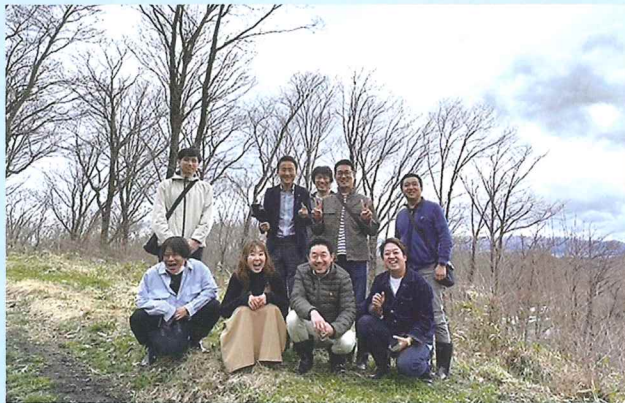
森林の牧場視察研修 (那須)

近年はDX進化と共によりデジタル化され、情報伝達のスピードも更に速まるでしょう。しかしながら人の心はアナログです。この我が故郷・益子町へも心を大切に持ち地域振興を続けていきたいです。