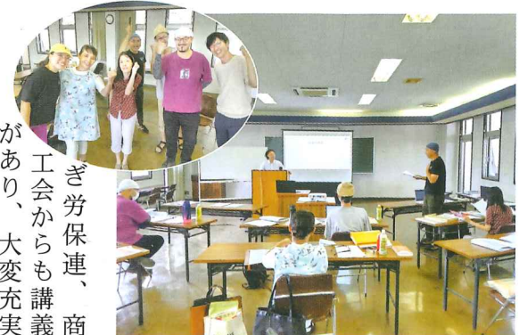
ぎ労保連、商工会からも講義があり、大変充実した時間となりました。

主講師は茨城県笠間市出身の方で、とても分かりやすく多様な内容を教えて頂きました。他にも益子町やまじらボ、栃木県信用保証協会、とち