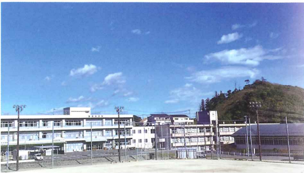
「津波避難ビル」に指定された中学校

11名)が参加して視察研修会の第一目的地である福島県大内宿に向かい、Lサイズの私には小さなマイクロスズの出発、薄つすら雪化粧の「道の駅しもごう」を経由して予定通り11時に雨に変わった大内宿に到着し傘が開く。「大切な村・宿場の景観」を未来の子供達に引き継いで行く為