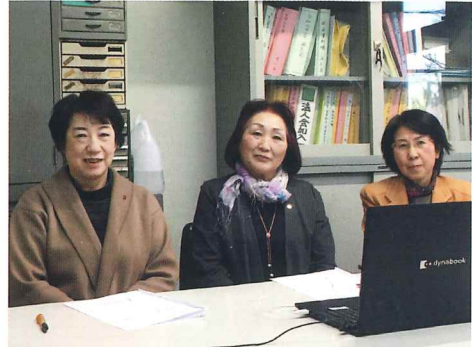
女性部リーダーWebセミナー