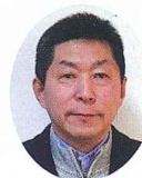
商工会長あいさつ