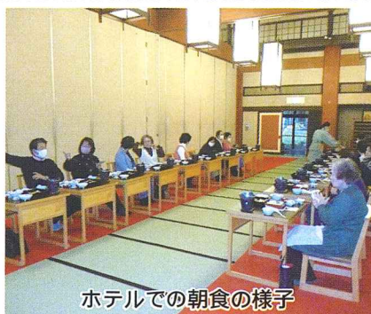
ホテルでの朝食の様子