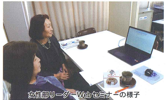
女性部リーダーWebセミナーの様子

今年の栃木県商工会女性部連合会主催の女性部リーダー等セミナーは、新型コロナウイルス感染症拡大防止のため、Web配信によるリモート形式での開催となりました。Webカメラを通してパソ