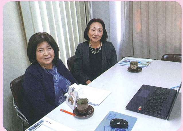
Web リーダーセミナー