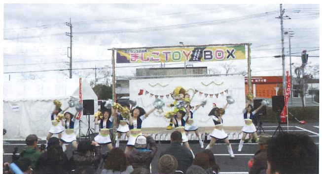
第6回ましこ TOY BOX