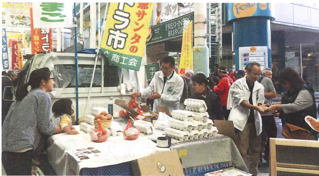
第5回全国軽トラ市 in とちぎ

E-mail mashiko-net@shokokai-tochigi.or.jp