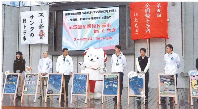
第5回全国軽トラ市 in とちぎ「ブラックボードコンテスト」