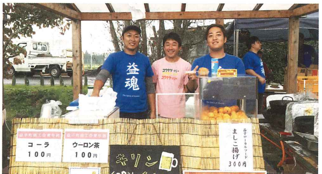
土祭・夕焼けバー