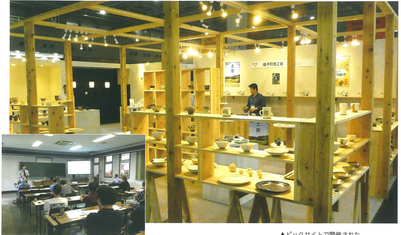
▲ピックサイトで開催された「ギフトショー2018秋」

E-mail : mashiko-net@shokokai-tochigi.or.jp